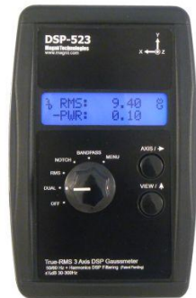
נתוני מכשיר DSP 523:

מכשיר מדויק בעל רגישות גבוהה המשתמש במעבד אותות דיגיטלי חזק. מודד בשלושה צירים את גודל וקטור השדה המגנטי (True RMS). בעל יכולת להבדיל בין שדה מגנטי שמקורו מרשת החשמל (50 Hz והרמוניות שלו) לבין שדה מגנטי שמגיע ממקורות אחרים.